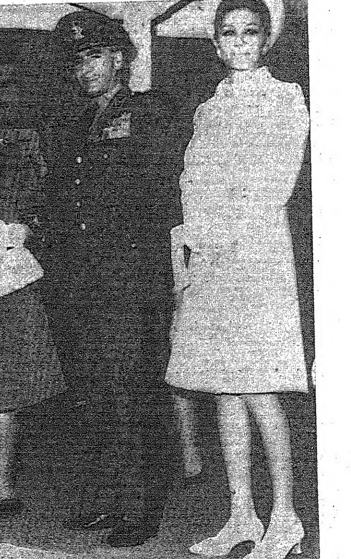
جلالة شاه ايران والاميرة فرح ديبا في استقبال الرئيس اليوغوسلافي يتو وزوجته لدى زيارتهما لطهران

كتدرائية جديدة للارمن في نيويورك نيويورك - رويتر - وصل البيطريك فيسكين الاول بطريك جميع الارمن الى هنا بطريق الجو كتنشيداً للكتدرائية الارمنية الجديدة في نيويورك .